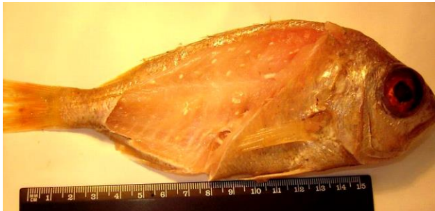
Рис. 1 Цисты Kudoa nova в мышцах зубана

пагеля и большеглазого зубана округлые или овальные, размерами 1.0 – 8.0 x 1.0 – 2.5 мм (рис. 1), от ставрид – округлые, 2.0 – 4.5 x 1.8 – 2.5 мм, от атлантических тунцов – шарообразные или слегка овальные, 1.0 – 3.0 мм в диаметре [10; собств. данные], из тихоокеанского снежного керчака – округлые или овальные, серо-белого цвета, размерами 0.5 – 4.0 мм [1].