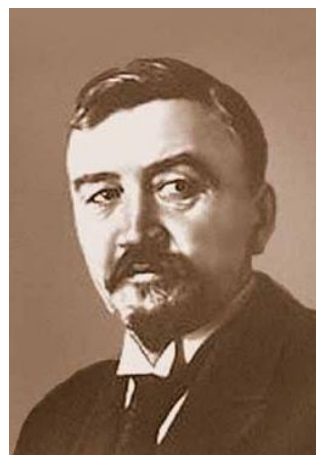
А. И. Куприн

А в 1909 г. он сообщает: «...приобрел имение и посеял виноград... Но меня лишили радости видеть плоды моих трудов. В Балаклаву, несмотря на все мои хлопоты, мне окончательно въезд запрещен... и я до сих пор не могу добиться права въезда в этот игрущий красавец городок».